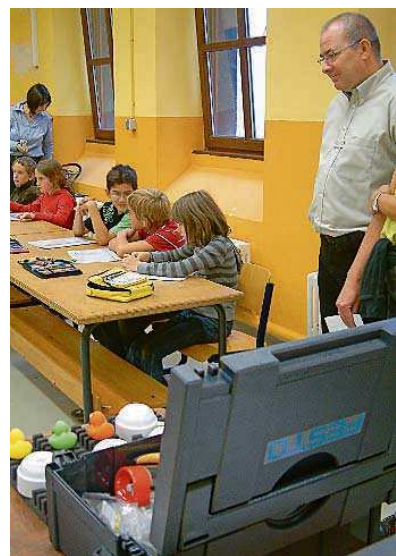
An der Albert-Weisgerber-Schule beginnt das neue Projekt „Abenteuer Technik“ mit dem Festo Lernzentrum.

Allen, die sich für die AG angemeldet haben, wird ein Licht aufgehen, denn sie werden unter anderem lernen, was ein Stromkreis ist. Mit der Kenntnis über die Funktionsweise der Fahrradbeleuchtung oder Klingel lernen die Kinder auch die Anwendung in der Praxis. „Anziehend“ oder „abstoßend“ kann es bei der Beschäftigung mit dem Thema Magnetismus werden. Mit all diesem Wissen im Gepäck wird zur Tat geschritten und selber ein Geschicklichkeitsspiel gebaut, bei